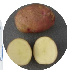
Gjennomskjæring av frisk potet