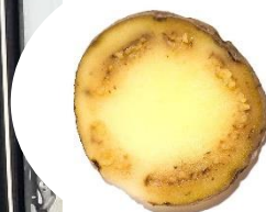
Potet med lys ringråte