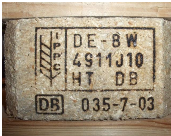
Figur 3 - Behandlet treemballasje er merket etter den samme standarden. Ved siden av IPPC-logoen vises først landkoden, deretter virksomhetsnummeret til produsenten og sist behandlingen som er enten HT (Heat Treatment) eller MB (Methyl Bromide Treatment).

Treemballasje med spor etter insekter (hull, gnag, larveganger) må destrueres. Mottar du treemballasje som ikke er merket, eller observerer du spor etter insekter, må du melde fra til Mattilsynet.