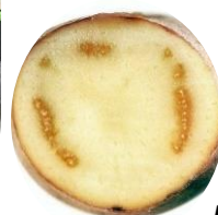
Potet med mørk ringråte